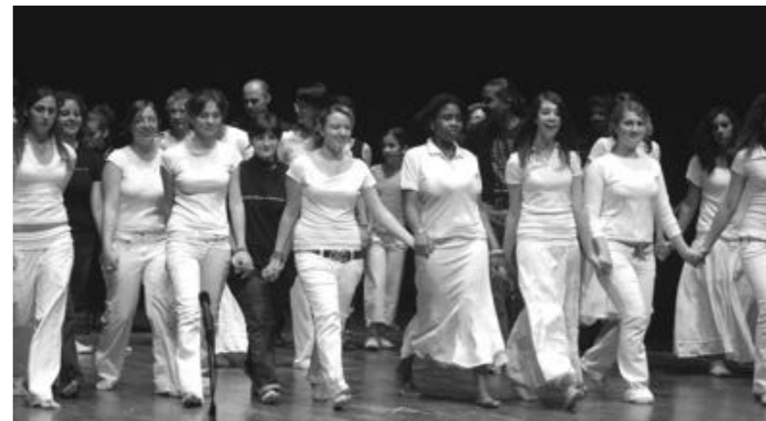
Sulla ribalta anche gli attori del gruppo "Asylum Seekers"