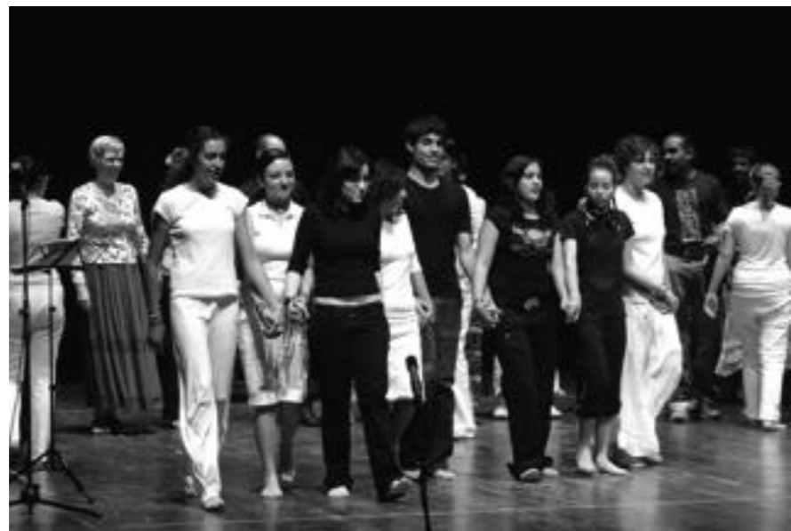
Fan e applausi nella penultima giornata della kermesse